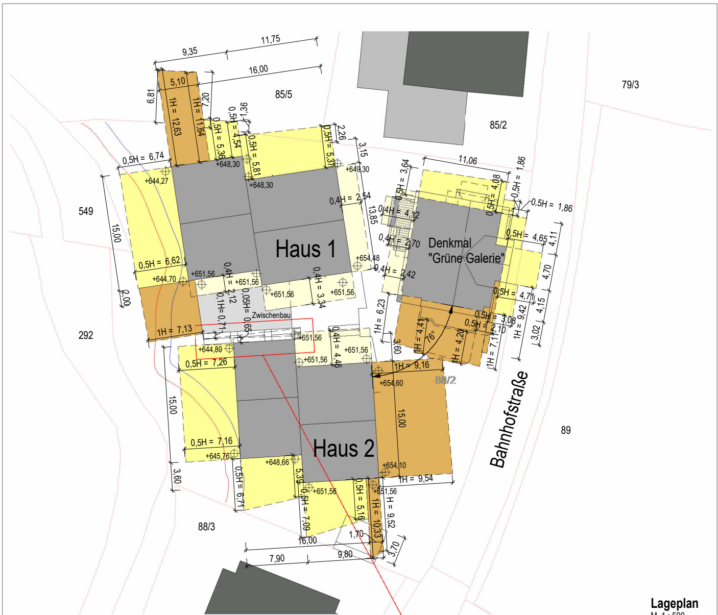
Lageplan M 1 : 500